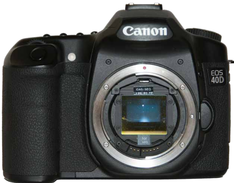
Ein Clipfilter im Bajonett einer DSLR

Eine elegantere Möglichkeit zur Filtermontage sind Clipfilter. Hier wird der Filter in das Kameragehäuse geklippt, kommt also hinter das Objektiv. So kann auch ein hochwertiger Filter verwendet werden und bleibt bezahlbar, da er deutlich kleiner ist als ein Frontfilter. Vor allem der IDAS LPS-Filter von Hutech als genereller Lichtverschmutzungsfilter ist sehr beliebt, Astronomik bietet auch speziellere Filter in diesen Fassungen an. Allerdings sind diese Filter vor allem für Canon-DSLR-Kameras verfügbar, Astronomik bietet auch Filter für Sony an und plant Filter für Nikon. Diese Art der Montage ist fast ideal, nur in seltenen Fällen kann es zu Reflexionen zwischen Objektiv und Filter kommen. Lediglich die Canon EF-S-Objektive lassen sich nicht mit diesen Filtern kombinieren, da hier das Objektiv in das Kameragehäuse hinein ragt. Dafür lassen sich für die Astrofotografie umgebaute Kameras (siehe Seite 114) auch wieder normal benutzen, wenn ein Clipfilter mit derselben Farbwiedergabe wie der ursprünglich verbaute Filter eingesetzt wird.