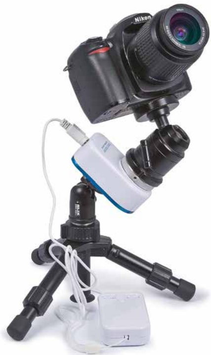
Ultrakompakt: Gerade bei kleinen Kameras passt eine Astro-Nachführung wie der nano.tracker wunderbar ins Reisegepäck.

Für einige Modelle wie Sky-Watcher Star Adventurer, Vixen Polarie oder AstroTrack werden direkt passende Polhöhenwiegen angeboten. Über das große 3/8"-Fotogewinde lassen sie sich auch mit den meisten anderen Modellen verbinden. Wichtig ist dabei, dass der ganze Aufbau stabil ist und kein Spiel hat – überprüfen Sie, ob alle Schrauben fest sitzen. Wenn sich das Stativ nach dem im nächsten Abschnitt beschriebenen Einnorden bewegt, war Ihre Mühe umsonst. Vergessen Sie dabei auch den Erdboden nicht: Wenn das Stativ im Lauf der Nacht in den lockeren Erdboden einsinkt, beeinflusst das die Nachführgenauigkeit ebenfalls.