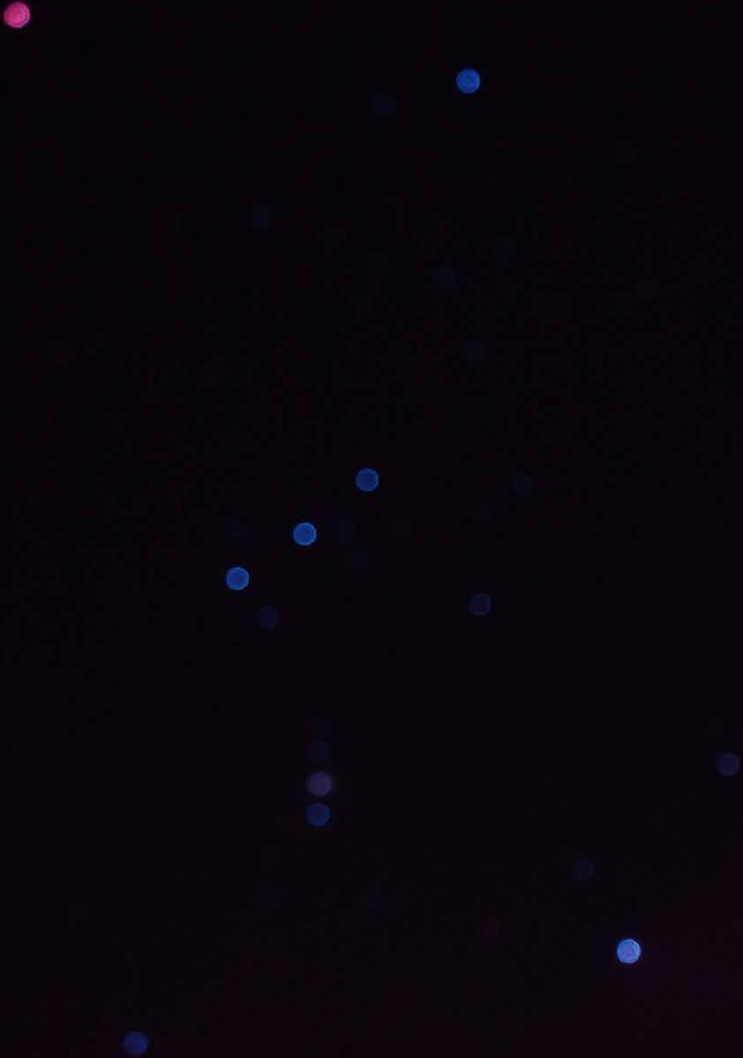
Eine unscharfe Aufnahme des Orion zeigt die Farben der Sterne deutlich.