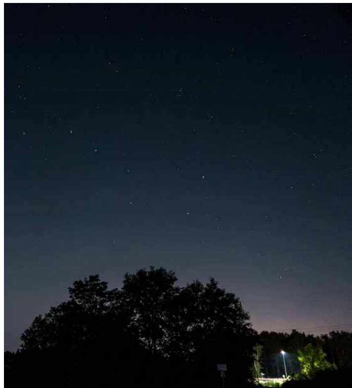
Zwei Aufnahmen mit identischen Kameraeinstellungen bei 28 mm Brennweite und identischer Bearbeitung. Das linke Bild wurde ohne Filter aufgenommen, der durch die nächste Stadt aufgehellte Horizont ist deutlich zu erkennen. Das rechte Bild wurde mit dem "nachtlichtfilter aufgenommen: Der Horizont ist immer noch aufgehellt, aber schon deutlich kontrastreicher als in der Aufnahme ohne Filter. Auch die Straßenlaterne ist dunkler.