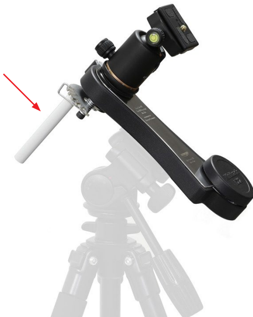
Ein einfaches Polsucherrohr (siehe Pfeil) am Omegon Mini Track LX-2

Wenn Sie ein modernes Smartphone mit ebener Rückseite haben und möglichst wenig magnetisches Metall am Stativ ist, das den eingebauten Kompass ablenkt, können Sie sehr komfortabel einnorden. Legen Sie einfach das Handy auf den Star Tracker oder – falls die Nachführeinheit zu viel Eisen enthält – auf die Polhöhenwiege/den Zweiwegeneiger und lassen Sie sich von der App den