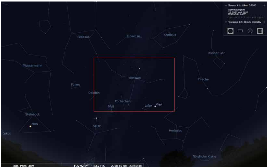
Das Okular-Plugin von Stellarium simuliert auch das Bildfeld einer Kamera.

Neben den 88 Sternbildern sind mit kurzen Brennweiten auch die ersten Himmelsobjekte machbar. Ausgedehnte offene Sternhaufen wie Plejaden, Hyaden oder der Coma-Sternhaufen wirken bereits auf Weitwinkelaufnahmen interessant, ebenso wie die Dunkelwolken in der Milchstraße zwischen den Sternbildern Schwan und Schütze. Auch die Andromeda-Galaxie M 31 oder der Orionnebel M 42 zeigen sich bereits.