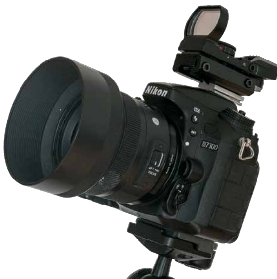
Eine Kamera mit aufgesatteltem Leuchtpunktsucher

Größere Astro-Montierungen verfügen über eingebaute Goto-Computersteuerungen, die die von Ihnen ausgewählten Objekte automatisch anfahren. Mit einer Reisemontierung müssen Sie sich dagegen noch selbst am Himmel auskennen. Aber keine Sorge: Das ist kein Hexenwerk. Beginnen Sie mit einer drehbaren Sternkarte oder einer Planetariums-App für das Handy und einem Einsteigerbuch, dann lernen Sie schnell die wichtigsten Sternbilder kennen. Auch die Webseite fernglasastronomie.de enthält viele Objekte: Was im Fernglas sichtbar ist, lohnt sich auch für die Kamera. Von markanten Sternen aus finden Sie dann auch zu den unauffälligeren Zielen. Ein Beispiel für dieses sogenannte »Star Hopping« haben Sie bereits kennengelernt: Die hinteren Kasensterne des Großen Wagens zeigen auf den Polarstern.